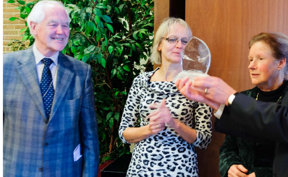
De laatste 'Glazemakerbokaal', de door Antonius Jan ingestelde prijs voor communicatie-uitingen binnen de OKK, ging naar 'De Oud-Katholiek'. (2009)

Glazemaker hield wel van een feestje. Bij de voorbereiding van een van zijn jubilea had hij laten vallen dat hij ‘zo’n vrouwenstrijkje’ wel leuk zou vinden. Met drie andere kompanen hesen we ons in jurken